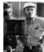
Óscar Blancarte (Mazatlán, Sinaloa, 1949)