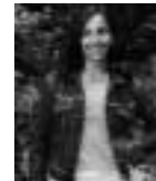
Gaby Dellal (Reino Unido, 1961)